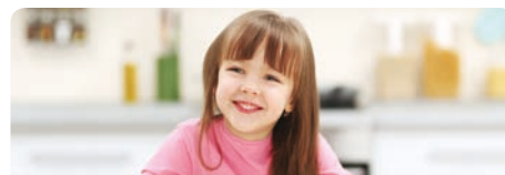
3-5 ANNI – SECONDA INFANZIA

Il pediatra segue lo svezzamento ed eventualmente si coordina con altri specialisti in caso di disturbi, ritardi o incoordinazioni motorie.