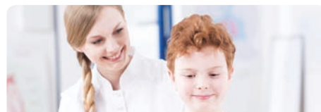
7-10 ANNI – FANCIULLEZZA

Il dentista valuta la salute e igiene della dentatura, l'ortodontista controlla la simmetria di viso e arcate dentali (in particolare morso crociato o aperto o prognatismo). Si valutano equilibrio, colonna dorsale, appoggio podalico, respirazione e deglutizione.