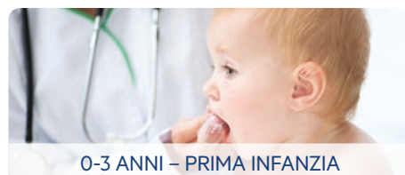
0-3 ANNI – PRIMA INFANZIA

Il pediatra segue lo svezzamento ed eventualmente si coordina con altri specialisti in caso di disturbi, ritardi o incoordinazioni motorie.